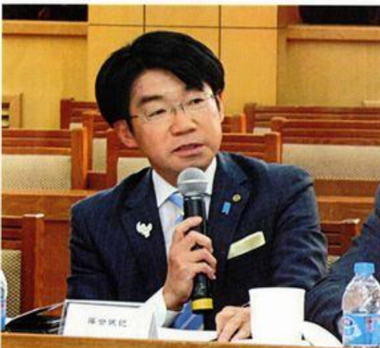
「中日青年交流座談会」にて、中国共産党の理想について質問